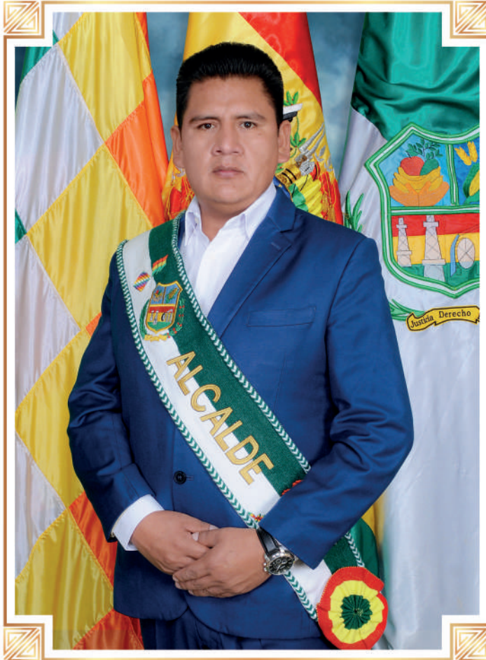
PEDRO GUTIÉRREZ VIDAURRE ALCALDE CONSTITUCIONAL Gobierno Autónomo Municipal de Sacaba